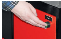
Vezérlőgomb gyűjtősín vágásához.