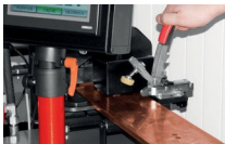
Vágás közben tartsa meg a gyűjtősíneket.

Teljesítmény: 3 x 400V / 230V; 1,4 kW vagy 1 x 230V