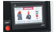
7 hüvelykes, forgatható LED érintőképernyő