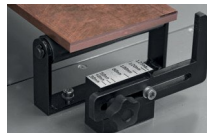
Kiegészítő gyűjtősíntartó, amely a pontos merőleges vágást segíti